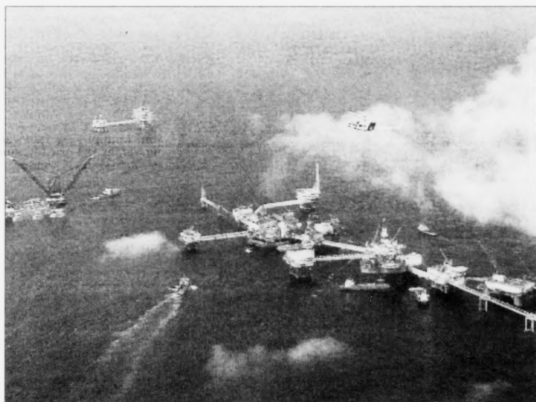
Ósemja er í lögtinginum, um treyt skal setast oljufølgnum, hvørja havn tey nýta, tá tey koma inn frá boripallinum