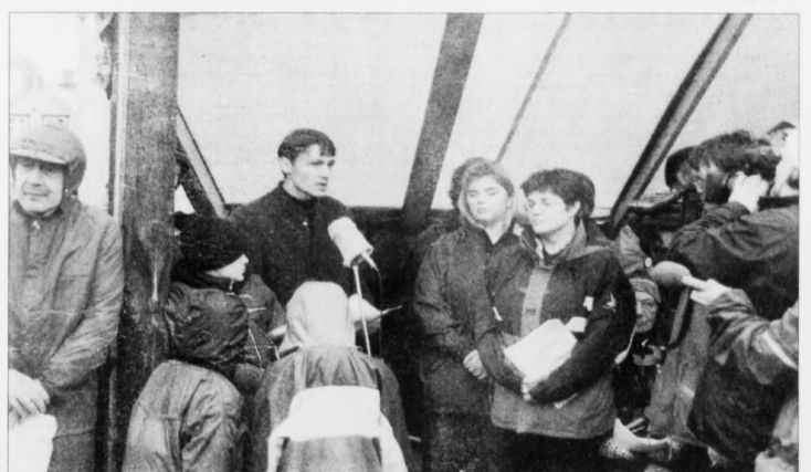
Lýftini frá fólkafundinum í Fugloy í summar um at nakað mál gerast fyrri útoyggiarnar verða nú kanska nærri einum veruleika. Fyribils verður tað to bara eitt alit, sum skal gerast