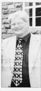
at landsstjórn má upp í aftur leikin, tá kommunurnar standa á hövðnum

Hvar hondan havn skal gígga, er ikki endalig avgerð tikin um enn, og sakin er í royndu veru eitt sindur flokt. Fyrst meiddi landsstjórnin at, at oljuhavnin skuldi vera á Tvøroyri. Síðani kom melding um, at landsstjórn helst ikki vildi blanda seg upp, tá ið avgerð skuldi tákast um, hvar oljuhavnin skal gígga.