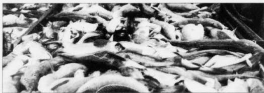
Harafrot hevur tele-selán hja Fiskamarknaðinum á Tofrum viku 33 í havt 24 avreiðingar, 223,3 tons fyrri 3.404.923 kr. Miðal klippisurin her var 15,23 kr. Virtilið yvir hesar avreiðingar um tele-seluna í viku 33 er hetta: