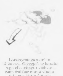
Landryðingurmortan 15-20 m/s. Skyggnið og kamska regn ella áringur viðivort. Sum fráður munni vindur, 8-13 m/s. Hvín 5-8 stíg.