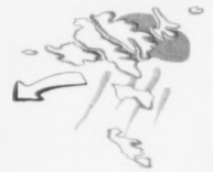
Landnybrúnguresstán, 8-13 má. Skýggj og tannul vøkur viðhvørt regnar seinnsparin kagar sól móguliga fram. Hitt 6-9 stig.