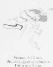
Vestan, 8-13 mis. Smáskvgjøgd og ælingur. Hitin um 6 stig.