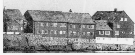
Nogvar tilsagnir um skip liggja í Tinganesi