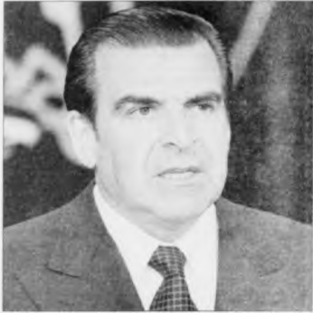
Chilenski forsetin, Eduardo Frei, vil vera við, at avgerðin hjá Yvirhúsinum níkudagin ikki er endin á Pinochet málinum

Ein leiðandi sosialistiskur politikari, Ricardo Lagos, hetti á Bretland um at utflýggja Pinochet til Chile, so hann kundi -standa til svars fyri gerðir sínar í heimlandi sínum, - sum hann segði, men hetta er helst lítið sannlíkt í fyrstu atlogu.