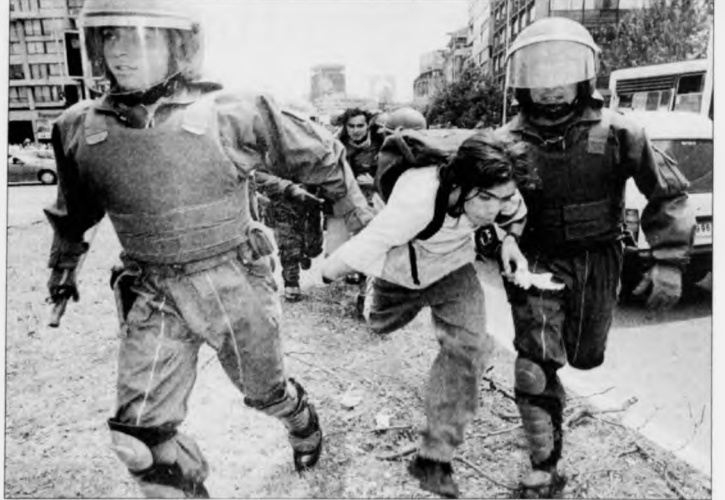
Ein Pinochet viðhaldsmáður verður handtikin á gøtum í Santiago, eftir at hava mótmælt, at bretsku Yvirhúsið hevur avgjørt, at Pinochet ikki verður latin leysur í fyrstu atlogu

Forsetin í Chile, Eduardo Frei, kunnuggjörði í gær, at hann for at senda eitt alment mótmæli til Bret-