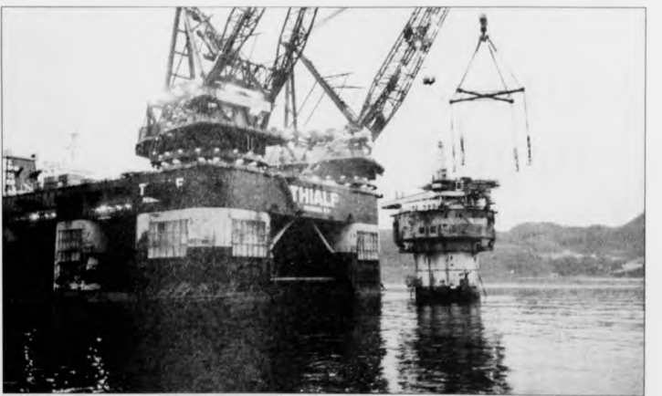
Kranaskipið -Trif- arbeidir við at taka óvasta partin av oljupallinum Brent Spar burtur. Nógv umstríddi parturin verður nu nýttur sum fundiment undir einari norðari bryggju

Í august á ár avgerði Shell, at tann útslitni oljupallurin skuldi nýstað til byggingna av einari bryggju í Mekjarvik nærhendis Stavanger. Bryggju var ein vevandi líøgt byggt einari imóti endanum á 1999