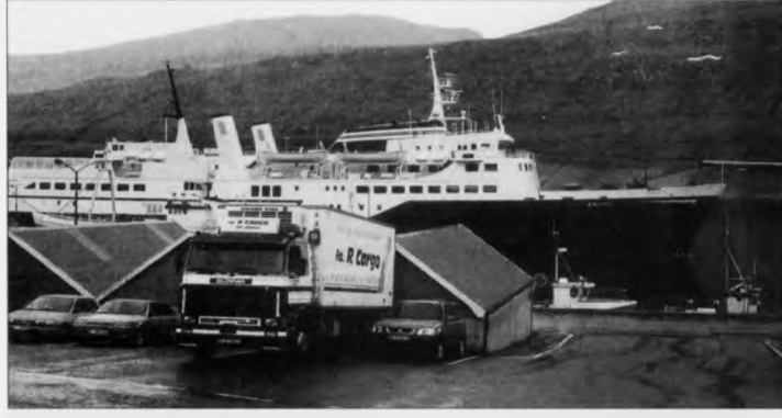
Smyril hevur siglt sína seinasta tur á Vág - á hesum sinni i øllum ferum. Men broystat umstøðurnar av hesum stig, er ikki óhugandi at hann aftur fer at sigla hagar.