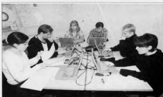
Telduflokkurin hevur lært nógva um at brúka telduna sum amboð.

Teldueldin byrjar um tveir ár, og nýtslan av teldu økist fyrri hvørt ár, sum gongur. Fyri tveimur árum síðan fer Handilsskúlin á Kambedal eini eina umfangandi verkætlan við einum telduflokki. Nú er flokkurin liðugur, og úrslitið hevur vist seg