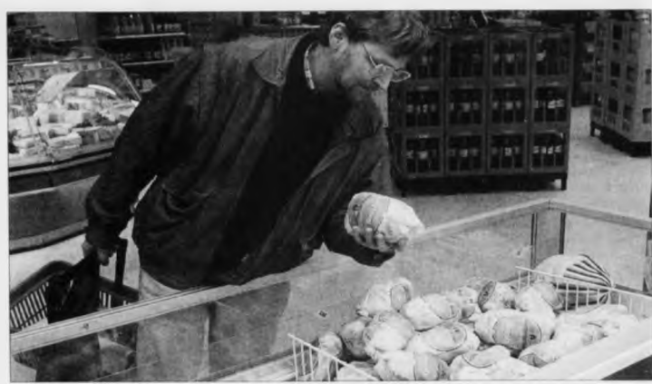
Skulu pengarnir rokka, er umráðandi at velja bæði biligan og sunnan mat