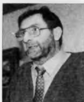
við lögvi stórúð fríkk undir land...