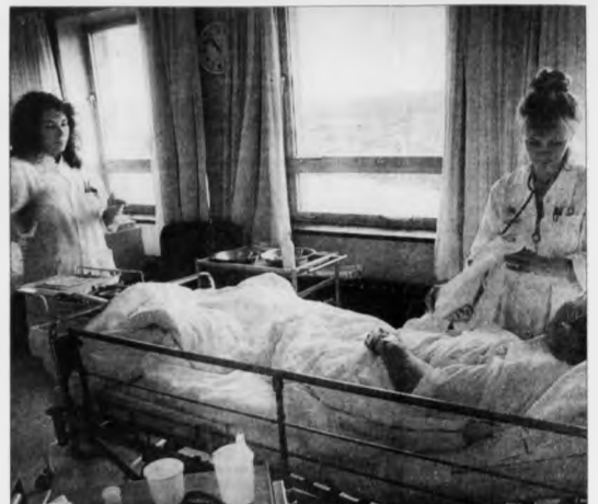
Hevur sjúklingurin verið fyrri viðgerð á sjúkrahúsi og har verið fyrri einhvøjr í hending, sum hevur gjørt heilsumstøðu hansara verri, hevur sjúklingurin í hægrium einstakum ferri verið nuyddur at reisa endurgjaldskrav móti sjúkrahúsværunum.

Hetta fer at merkja, at føroyska login, um hon kemur óbroytt í gildi, verð