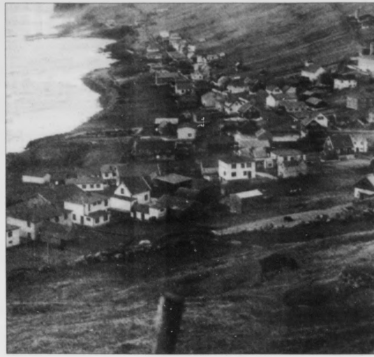
Við bergholinum til Sumbiar verða nu skaptir møguleikar fyri at fara undir vinnuligt virksemi. Sumleiðis verður flutningurin lættari og høgligari hjá teimum utrorðarmonnum, sum liva av hesum, men sum ikki kunnu hava batar sínar liggjandi trygt alt árið í heimbygdini

Hetta vegastrekkid er í mangar mátar eitt ringt pláss til veður, og liggur