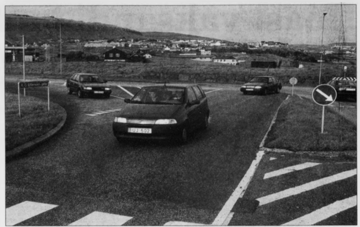
Á vegkrossinum Ringvegur/R.C. Effersøesgøta eru eini fyra óhapp hend, síðan ferðslutreytirnar vórðu broyttar nakað herfyri.