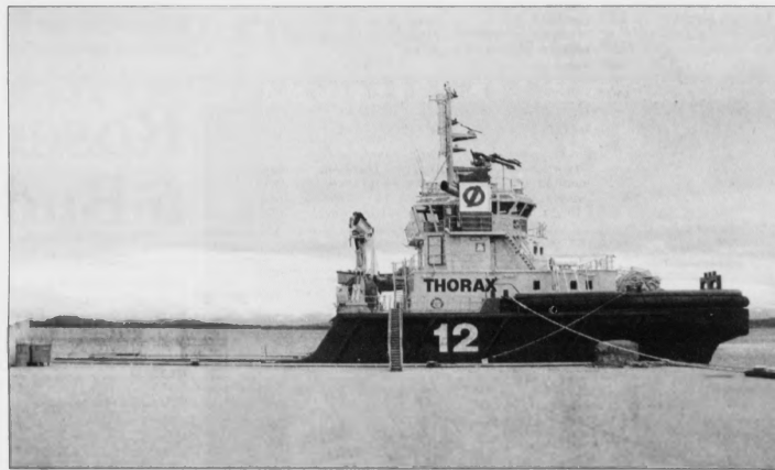
Ein slíkur sleipibátur fylgir hvørjum tangaskipi seinasta strekkið til Sture oljuterminalin. Hann festir seg í tangaskipið har afturi og er soleiðis ein eyka trygd, um eitthvørt óvantað hendir við motorinum ella styrriambodunum hjá skipinum

Neyðugt er eisini, at tangaskipini, sum skulu ferma oljuna, hava rættu útgerðina til at endurvinnna gassið úr oljudampinum. Nyggjastu tangaskipini