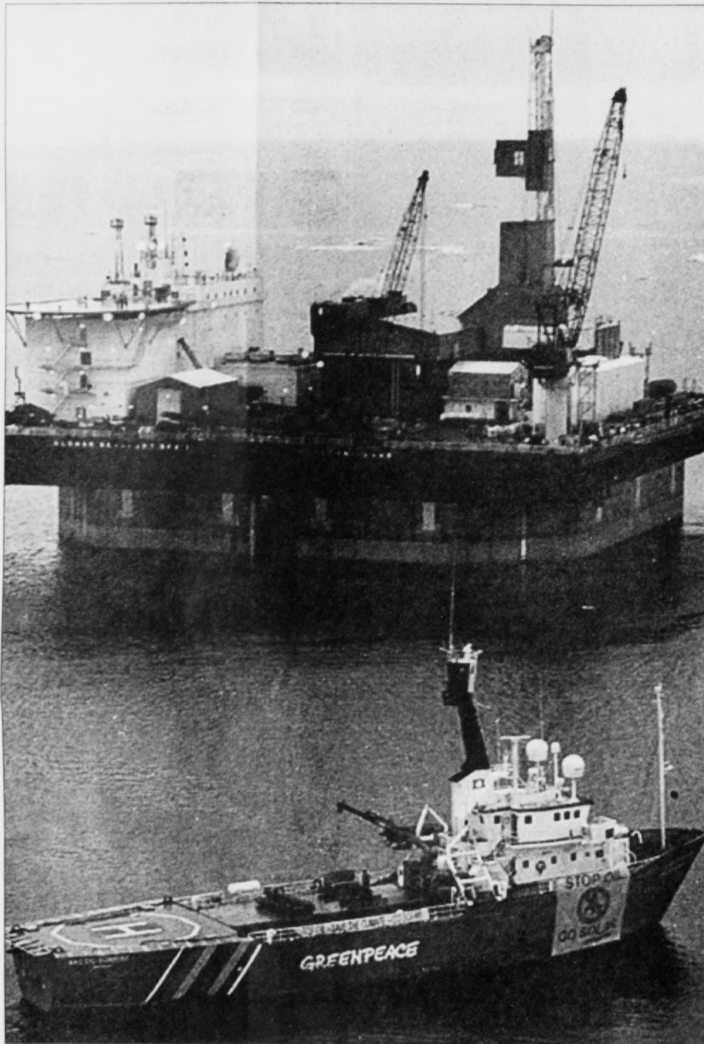
Greenpeace ger alt fyr í stöðga nýggjum oljuboringum, eitt nú norðan fyrí Skotland. Men eygileðarar halda ikki, at Greenpeace fer at fáa nakað burtur úr øllum ströðnum

Eygleðarar eru samdr ikki hevur nakað beinleiðis fokus, og av tí at BP hevur sett eina ræva av pengum í atlanina, fer oljufelagið undir ongum umstøðum at bakka.