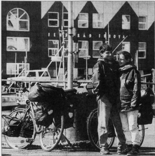
Føroyskir ferðasmíðir ætla sær einn fleiri ferðafólk næsta ár