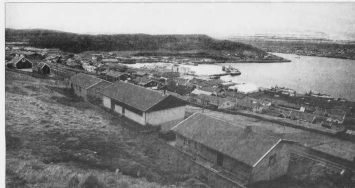
Leygardagin fær almenningurin hevi at vitja nýggju býráðshúsin í Runavík