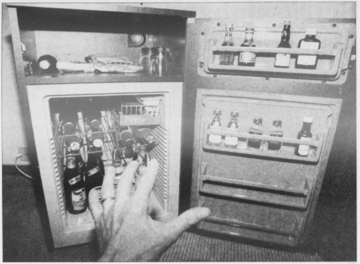
Palliba og Marsanna kunnu ikki fáa eina slíka inn á hotellkamarið uttan at gjalda depositum fyrst. Men prominenter utlendskir gestir kunnu leska sær sum teir vilja upp á almenna rökning til Palliba og Marsanna.

Men hotellini upplýsa fyrri Dimmalseting, at vónleyst er at umsita hesa reglu eftir lögartekstinum. Um t.d. ein handilsferandi utlendingur bíleggur ein enskan buff við reyðvini afturvíð, so verður ikki kravt, at hann leggur penningin á borðið, aðrenn skontt verður í glasið. Vanliga mannaogongdin er, at góldið verður við fráfert ella at rökningin verður send fyrirtökuni máðurni umboðar.