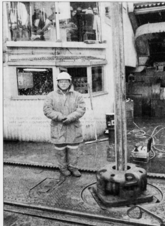
Royndirnar, sum hesa vikuna eru gjørdar á Ullrigg-boripallinum á landi við Rogalandforsking í Stavanger, hava gívið góð úrslit. Ta einaferð verður farið undir oljuboring í Føroyum, kunnú nógvar milliónir sparaast við hesum borinum.