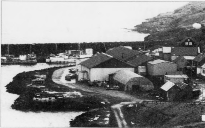
Alt bendir á, at flakavirkjó á Eiði verður selt burtúr P/F Fiskavirkning