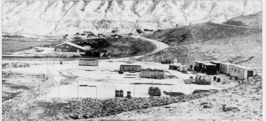
Tað er aftur vorðin gerandisdagur í Lopra