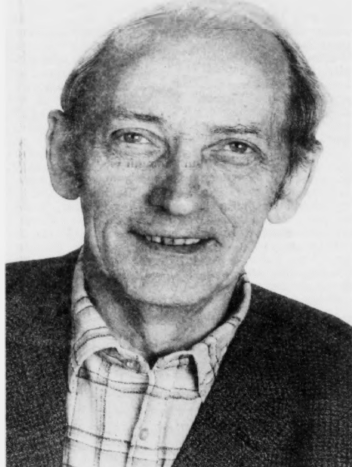
Eli Nolsøe, føddur 20. mars 1920, deyður 20. november 1996. Landsstyrismaður fyrri Sambandsflokkin 1970-75. Løgtingsmaður fyrri Sambandsflokkin í Norðoyum 1978-84

Mikudagin 20. november andaðist Eli Nolsøe, fyrrverandi landsstyrismaður, Klaksvík, 76 ára gamal.