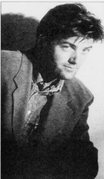
Michael W. Smith hevði stórtingna konsert í Runavík mánaðkvöldið

sertin av ongum. Men Michael W. Smith hevði eisini manadagin til taks. Og tá bar til. Framfarslan hjá amerikanska sangarnum man vera ein tann størsta í Føroyum nakrantíð, tá hugsað verður um pall, ljóð og ljós. Sjálvt TOTO, sum hevdu rúmmarkonsert á Hási fyrr í summari, høvdu ikki so nógva ljóð við sum amerikanski sangarin. Hinvegin, so mundi all-arhelst knipa hjá Michael W. Smith at lokka so nógva fólk frá húsum. Tað ljóðaði, at ókært um 900 atgongumerki voru seld í forssolu. Um 1600 feringar hoyrdu TOTO, tað bolkurin vitjaði.