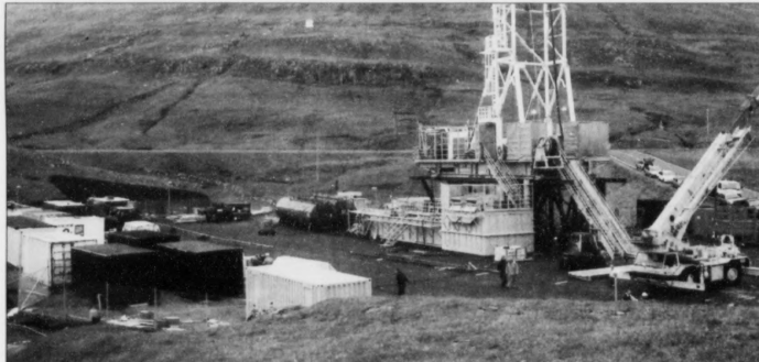
Stórur spenningur valdar, nú borurin í Lopra nærkast teimum 3.500 metrum

Á heysti í 1992 fóru tveir mans til Danmarkar. Ørindini vóru at tosa við donsku stjórnina um framtíðina hjá føroysku undirgrundini. Hvønn leiklut skuldu Føroyar hava í hesum sambandi í framtíðini? Óvart mundi tað koma á teir báðar, at dansk forsetisráð-harrin var í júlajáhr.