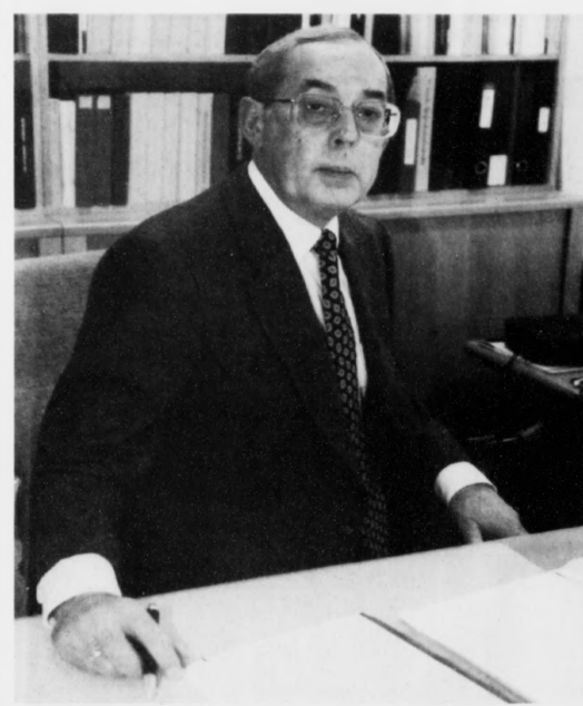
Fútin: - Vit mugu sum skjótast fara í holt við at fyrireika eina tilbúgvingarskipan fyrri alt landið, í annars gerast vit eftirbátar, ta oljuvinnan er komin