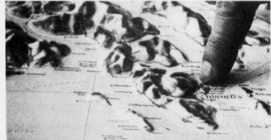
Neyðugt verður eisini við eini floghavn í miðstaðarokinum, helst á Glyvursnesi. Tí hugsar tú um tær stóru dimensjónirnar í oljuvinnuni, so lýkur miðokid nátturliga kravini háðan. Her eru mestu henteikarnir savnaðir á einum stabi - eitt nú útgærð í sambandi við tilbúgvingarleiðir og tænastuvinnur.

Men eg er sannførdur um, at neyðugt verður eisini við eini tyrluhavn í miðstaðarokinum, helst á Glyvursnesi. Tí hugsar tú um tær stóru dimensjónirnar í oljuvinnuni, so lýkur miðokid.