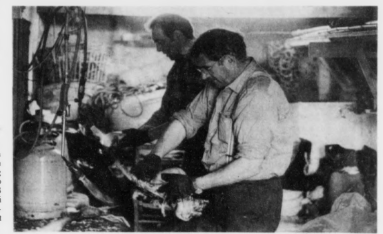
Tað er av týðningi, at reinførið er gott, tá nátaungar vera hægriðir. Her sviða teir havhest uti á Argjum.

Hann visir á, at í 1998 verður øll flugving í Europa pura fri. Og tá kunnu fóroyingar ikki framvegis loyva sær at tala um at verðveita einkarætt hjá ávísium feløgum til flugvingina higartil.