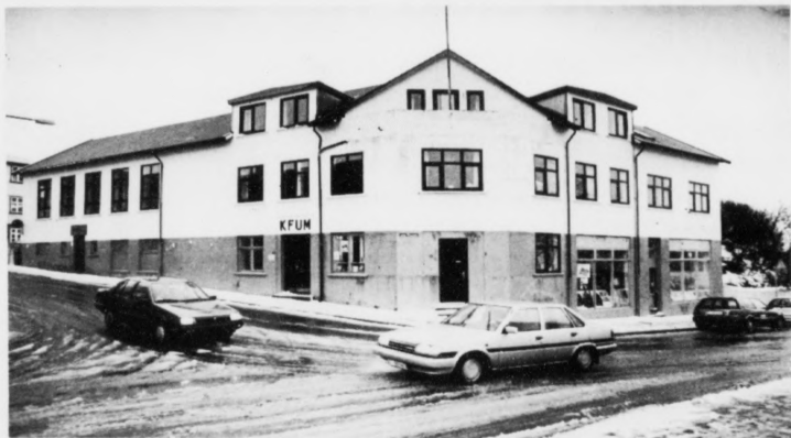
Aftur í heyst skipar Kvinnuhúsið fyrri sjálvhjálparbólki og ætlanin er at hava ein bólki við incestoffurum.

Kvinnuhúsið roynir at savna kvinnur við eintáttáttum trupulleikum, so tær kunnu hjálpa hvørjari aðrari. Kvinnuhúsið skipar fyrri sjálvhjálparbólki, hvør heyst og hvørt vár og vanligu eru tveir bólkar hvørja ferð. Nógvir ymskir bólkar hava verið, til dømis hevur ein verið við avvarðandi hjá alkohólikarum. Ein annar bólkur var um anorexia og uppáttur onkur annar um sorg. Eisini hevur Kvinnuhúsið áður havt ein sjálvhjálparbólki við kvinnum, sum hava verið fyrri kynsligum ágangi í uppvøkstrinum. Vanliga er eisini ein sálarfrøðingur ella onkur annar kónur á teimum ymsu økjunum við í sjálvhjálparbólkunum.