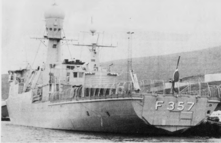
Sjöverjuskipið Thetis skjýtur í lötuni seismikk fyrri Western undir Føroyum

Sjöverjuskipið Thetis skjýtur í lötuni seismikk undir Føroyum. Tá vit um middagsleitið í gjár tosaðu við skiparan Herluf Rasmussen, var Thetis í gongd við at skjóta seismikk á næstsíðstu linjuni vestanfyrri Føroyar. Einans 400 av 2000 kilometrum eru komnir í telduna, tí