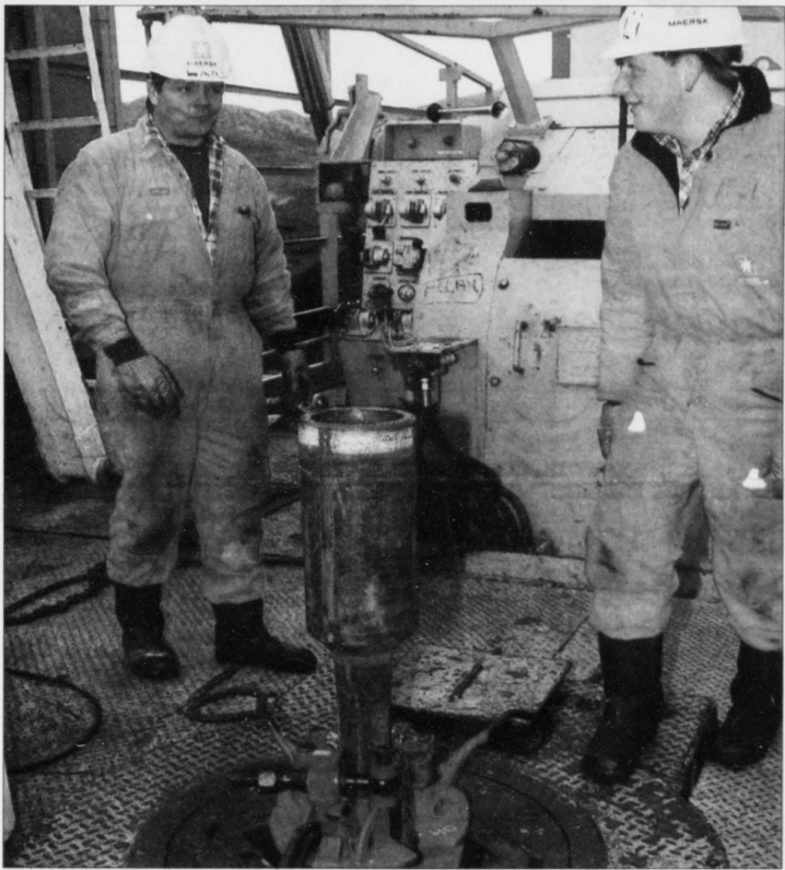
Borin í Lopra byrjar av áttára í næstu viku. Men í fyrsta umfari er tað ikki sjaltvari oljuni, teir fara eftir – borað verður fyrst bara eftir upplýsingum.