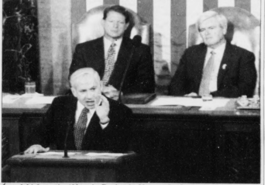
Israeliski forsætisráðharrin Benjamin Netanyahu bar mikudagin amerikansku Kongressini ein boðskap, sum í stóran mun snúði seg um at fáa varandi frið í Miðeystri.

– Jerusalem verður ongantíð byttur sundur. Vit fara ongantíð at loyva, at ein Berlinmúr verður reistur mitt í Jerusalem. – Sunn vantað bleiv hann mottikin við loyvaðrestum í Kongressini fyrri síni uttanríkispolitisku og buskaparligu sjónarmið.