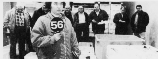
Fiskamarknaður Føroya heldur til á Toftum

Mánadagin í hesi vikuni keypti Hansen Seafood 16 tons av tí teir hildu vera so kallaður daggamal fiskur.