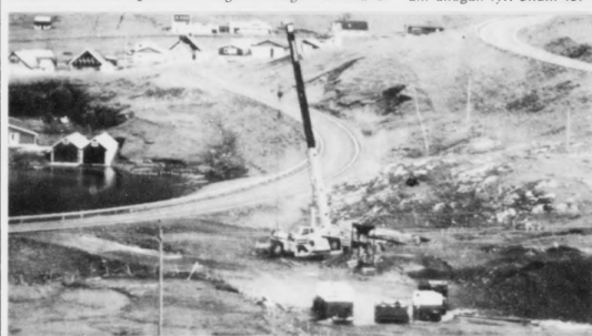
Siðan forkanningarlögin varð samtykt og sett í gildi á heysti 1993, eru givin nóggu loyvi; seks teirra eru framhaldandi í gildi. Lopra-verkætlanin er sostatt bara ein av fleiri forkanningum, og peningaliga er hon ikki tann størsta forkanningin higartil.