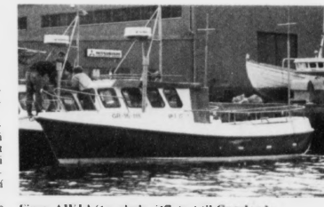
Fimm AWJ-bátar skulu útflutast til Grønland

Keypskostnaðurin er 600.000 fyrri hvønn bátin. Landsstýrið rindar 8 prosent soleiðis, at fyrntøk- an sleppur undan tollfor- litingum og portum av flut- ningskostnaðinum.