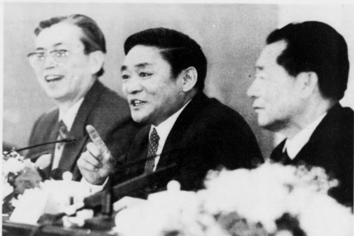
Raidi (í miðjuni) greiðir frá, at teir hava funnið reinkarnatiónina hjá næstheilagasta manni í Tibet.

saknaður, eins og familja hansara og aðrir munkar eisini eru. Men Raidi sigur, at frágreiðingarnar um, at drongurinn er settur í fongslul, er tann reini heilasuni.