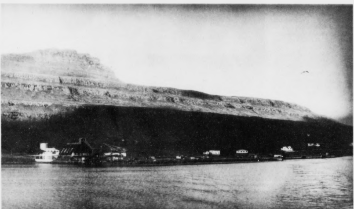
Drelnes verður bugvív út til oljuútgærðarstöð. Hetta er ein tann fyrsta royndin hjá okkum at vísa krefftir, hvat vit dugja í hesi nýggju vinnu í Føroyum