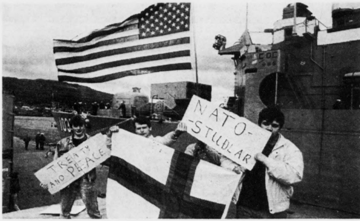
Tá USS McCloy kom á Havnina í 1987, vóru fólk og mótmæltu og fagnaðu skipinum. Nú er spurningurin, um NATO-flögjur skulu sleppa at seta seg í Vágum.