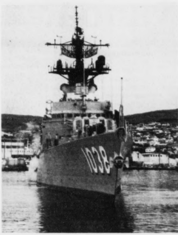
USS McCloy stevnr inn á Havnina

Kann NATO sleppa at brúka flogvøllin í Vágum, tí hon veit ikki, um eitt tíðli loyvi er í samsvari við tær lögtingssamtyktir, sum eru gjørdar um hernaðarmál.