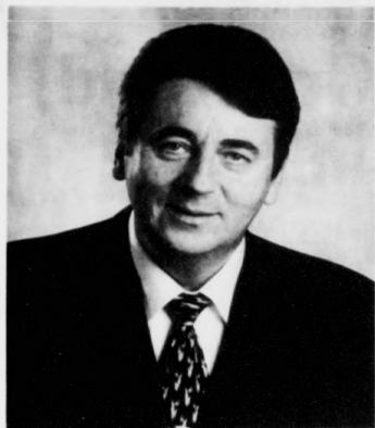
Sambært uppskotinum hjá forstjóranum í Tinganesi skal Óljufyriritingin ikki hoyra undir lögmann, tá nýggja landsumstíngin fer at virka.