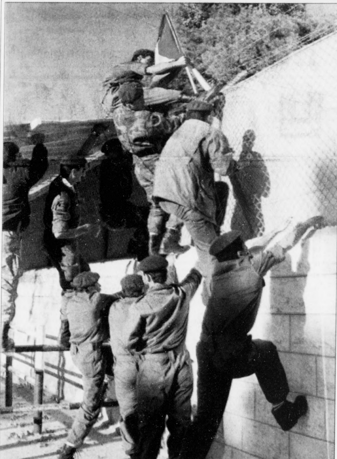
Palestinarnir politikarar við einum palestinskum flaggi á veg upp um múrin á nú fyrrverandi israelska høvuðsstaðini í Ramallah. Mikudagin fóru israelar úr býnum eftir 28 ára drúga hertøku.

Eisini á øðrum økjum er ein gløtti at homa fyri Ramallah, tí PLÓ-leið-arin Yasser Arafat hevur umhugað at hava byin sum sitt nýggja høvuðs-sæti. Hetta fer vørandi at henda innan fyri eitt ár ella so.