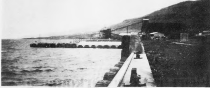
Tvøroyrar kommuna hevur bjóðað ókið á Drelnesi út til virksemi, sum hevur samband við oljuvinnuna. Men sum fíggarumstøðurnar eru beint nú, er kommunan ikki for at sjávt at gera lögur. Neyðugt er við neyðum samstarvi við aðrar kommunur, feløg og fyrirkæmur - bæði burtur og heima