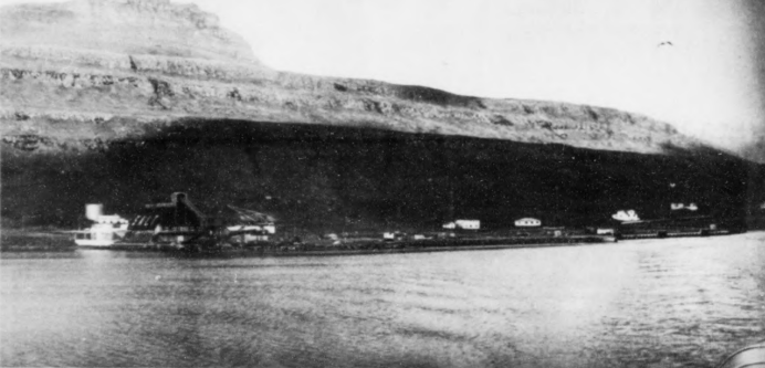
Órsøkin til ókyrruna uti fyrri ferjulegum er ein heilvuskultúr í botninum. Og tað er serliga á landnyrðini, at ókyrra er. Men við gamla partin av bryggjuni - á leið har sum saltsíloin er - er væl liggjandi í øllum veðri