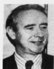
Anthony Layden, embætis- maður í bretska uttanríkis- ráðnum: – Føroyingar tapa at fara til Haag! Bretar hava slept sinum uppruna- ligu krav, og færoyingar hava slept krávinum um miðlinju. Nu er ein endalig semja ikki langt burtur

– Føroyingar hava so haldgóðar grundir fyri sínum sjónarmarkum í miðlinjuspurninginum, at spurst einki úrslit burtur úr embætis- manninginum, eigur politiski mynd- ugleikin ikki at óttast fyri at lata altjóða domstólin í Haag av- gera málið