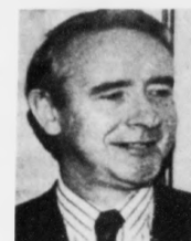
Anthony Layden, embætis- maður í bretska uttanríkis- ráðnum: – Vit seta at geva hesum samráðingunum ein kjans. Men vit sleppa ikki mið- linjuprinsipiinum, og um so er at einki nøktandi úr- slit spæst, næstast vit ikki domstólin í Haag

– Fýröyngjar hava so haldgóðar grundir fyri sínum sjónarmarkum í miðlinjuprinsipiinum, at spurt einki úrslit burtur úr embætis- mannatinginum, eigur politiski mynd- ugleikin ikki at óttast fyri at lata alþjóða- domstólin í Haag av- gera málið