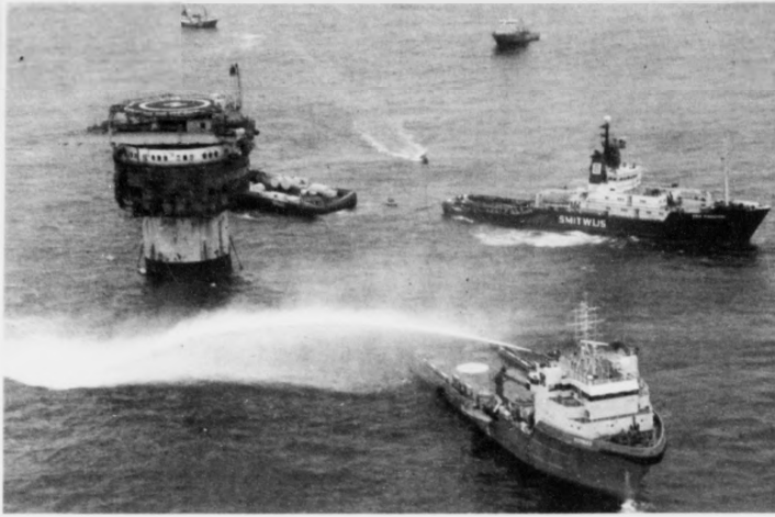
Hóast Shell hevur slept ætlaninum at søkkja Brent Spar, so verður framvegis kjakast døgliga um umhvørvisliga avleiðingarnar av eini tilkari burturbeining.