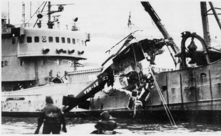
Tyrluvanlukkan á Borðoyarvík 16. desember 1992 hendi av mannaávvum, verður sagt í frágreiðingini hjá Havarinevndini

Flogskiparin á Vípani leyk ikki ásettu treytirnar um náttarfluging við ferðafólki. Hetta er fyrsta punktið í niðurstøðuni hjá Havarinevndini. Sagt verður, at ásetta kravið er triggrir starrir og triggar lendingar seinastu 90 dagarar, áðrenn ein kann flúgva um náttina við ferðafólki. Víðari verður sagt um