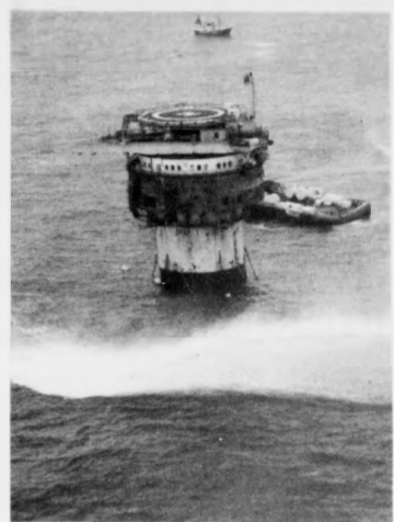
Nýgur rumbul hefur staðist af loyvinum, sum engilska stjórnir hefur givið Shell at sökkja oljuboripall teirra «The Brent Spar» í Norðsjónum.