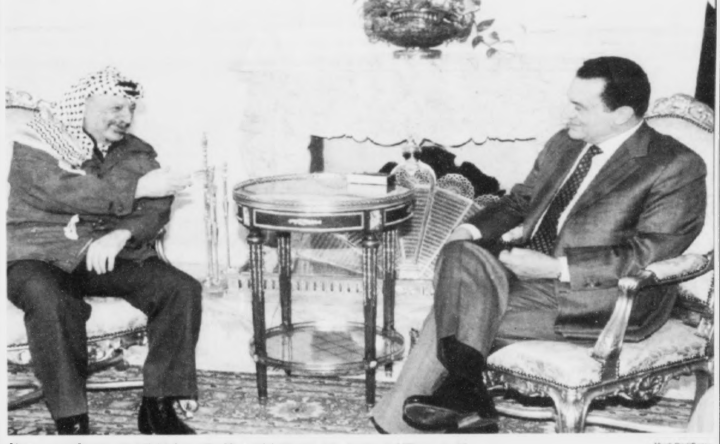
Yasser Arafat og egypskt forsetin Hosni Mubarak høvdu fund í Kairo í gjár

menn, segði Yasser Arafat, tá hann kom aftur til Gaza í gjár.