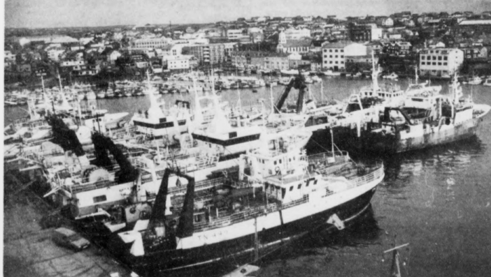
Landsstýrismaðurin Óli Jacobsen hevur á fundi við fiskivinnunevndina greitt frá, at landsstýrið vil geva vinnu betri møguleikar við at býta um skip og harvið varðveita arbeiðs-pláss. Men minnilutarnir í fiskivinnunevndini halda, at um uppskot frá landsstýringum um stúðul til fiskiskipflotan, sum hevur við sær møguleika at býta um skip, verður samtykt, kemur tað at fúa øvuga ávirkan. Tað vil sá, at vit koma at niðurlægja arbeiðs-pláss. Hetta kemur serliga av tí, at flotan - serliga partrolararnir - var ov stórur tá upprunalógin kom í gildi. Tað, sum landsstýrið nú ger, er at seta hesi skip inn aftur í fiskiskapin.

Landsstýrismaðurin Óli Jacobsen hevur sum nevnt á fundi við fiskivinnunevndina greitt frá, at landsstýrið