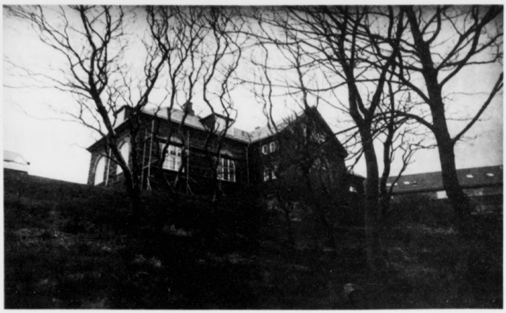
Bygningurin, har gamla landsbókasavníð og forngrípasavníð húsást, er sera vakur. Oljufyriritingin fer nú undir táknið saman við Jarðfrøðisavningum og DGU.

Eitt krav er, at tann fiskur, sum útróðrabátarnir fiska, skal arbeiðast upp á landi, og tað fer tann stóri toskurin til Toftir, tí hann skal viðgerast á ein serligan hátt sambært krøvum keyparans. Keyparin vil hava saltaðan tosk, har toskaflakið skal vera so tjúkt sum møgilst.