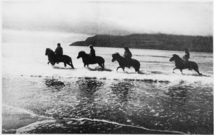
Rossini eru seinastu árin vörðin partur av føroysku ferðavinnuni.