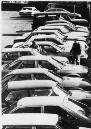
Bilasølan hevur aftur fótá sær, og higartil í ár eru seldir 80 nýggj bilur

Bilasølan í Føroyum er økt munandi í ár sammett við í fjør, tá samlaða talið av nýseldum bilum var 172. Longu í ár eru 146 nýggj bilur seldir. Hetta kemst bæði av, at lagaligan er at fáa lán til bilakeyp enn tað hefur verið seinastu árin, og at tollurin á bilum er lækkar munandi, verður upplýst á Motorkontónum á Futaskrivstovuni. Tollurn á bilum lækkaði munandi í februar í ár, og tað gjørdi, at sølan av nýggjum bilum alt fyr eitt fòr upp. Bár í apríl kann upplýst, at 80 nýggj bilur vóru seldir. Hetta er ein munandi ókin í bilasølu, má sigast. Annars liggja talini á nýggjum seldum bilum í ár soleiðis, at í januar vóru 6 bilur seldir, í februar 29 og í mars 31. Longu her í maí