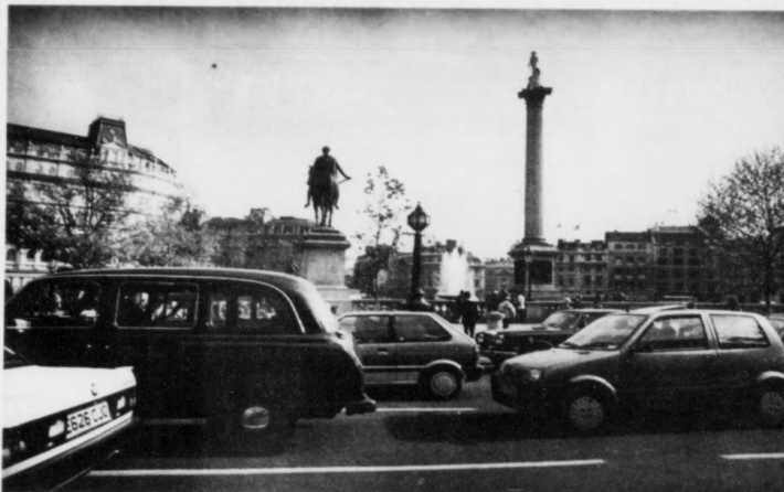
Her sæst Lord Nelson lýta yvir Trafalgar Square á hogari sílu. Beint við hefur Enterprise Oil hævubúskrivstovu í London

Tað verður nögv gjørt burtrur, at hvør einasti ein kennir mannagongdina í sambandi við soft-shores. Aðrenn avstæðferð var nögv gjørt burtrur at upplýsa, hvussu ein skuldi fyrhalda sær, um eitthvørt hendi við trygðin. Hetta varð gjørt við einum stuttum sjónvarps-