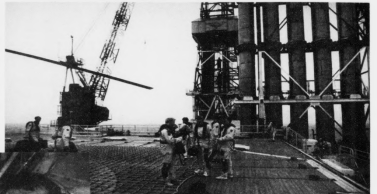
Tyrlan hefur sett á Nelson oljupallin, ið tókst ristastórur hjá teimum heldur smærri feroyingunum

Heilin á oljupallinum er eitt kontroll-rúm, ið hefur eftirlit við allan framleiddsluna av olju og gasi. Her situr ein eftirlitsmaður 24 tímar um døgðin. Kontrollrúmið sendir út allar