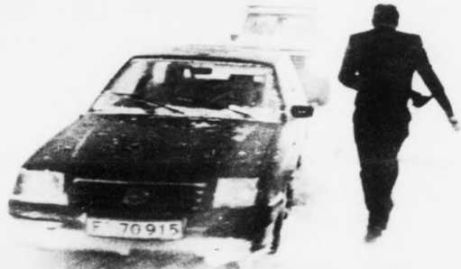
Kavaódn herjaði um alt landið seinnapartin leygardagin. Fleiri bílar rendu seg fastar í skalvum millum bygða