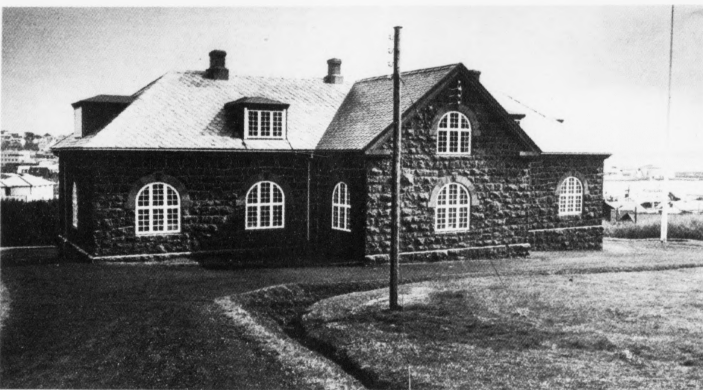
Tað er heldur óvist, hvørt Oljufyrisingin yvirhøvur flytur inn í gomlu bókasavnhúsinum. Flestu halda tað vera heit burtur við, og onkur mælir til at Fróðskaparsetrið flytur inn í staðin

Síðani er tað hent, at Føroya Forminnissavnið flutti í húsinum hjá Málindahúsinum í Hoyvík. Tað er so státt framvegis ikki ov seint at broyta verandi ætlanir. Hvussu er og ikki, í letuni fara umbyggingar fram hvørs endamálið er at seturskrivstovnan skal flyta inn í eini gomlu sethúsin, meðan Oljufyrisingin ætlandi skal flyta inn í tann annars hábærsliga lærða háskúlan.