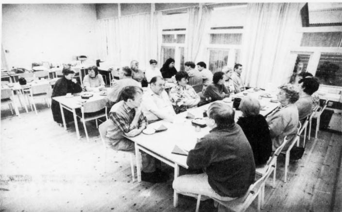
Hugnalata var á Blindastovnum mikudagin, tá skeiðið fyrri blind og sjónveik endað